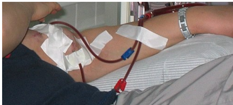
A-V shunt kanylovaný dialyzačními jehlami připojenými k dialyzačnímu přístroji

Pro napojení pacienta na dialyzační přístroj („umělou ledvinu“) je třeba chirurgicky vytvořit arteriovenózní zkrat (A-V zkrat, A-V shunt, fistule, píštěl). Jedná se o vytvoření komunikace mezi tepnou a žílou. Tato komunikace následně slouží k zavedení dialyzačních jehel, které přivádějí/odvádějí krev do/z dialyzačního přístroje. [1] Dialýza samotná spadá do odbornosti nefrologa, vytvoření A-V zkratu náleží cévnímu chirurgovi. V případě nemožnosti vytvoření A-V zkratu nebo v případě urgentnosti situace lze k dialýze využít speciální dialyzační žilní katetry .