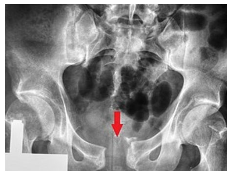
Zlomenina symfýzy typu otevřené knihy

Začíná se s protišokovou léčbou, zastavuje se krvácení a stabilizuje se pánevní kruh . Nutností je v nejbližší možné době provést repozici a stabilizaci pánve zevním fixátorem. U poranění typu B se přední segment pánve fixuje dlahou nebo zevním fixátorem, u typu C se používá dlahu nebo zevní fixátor ke stabilizaci předního segmentu, zadní segment se fixuje šrouby, dlahou nebo svorníky.