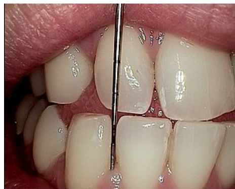
Vyšetření parodontální sondou