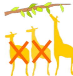
Přírodní výběr dle Lamarcka, ve skutečnost to však takto nefunguje 100%.

Jedno z důležitých kritérií pro vymezení druhu je reprodukční izolace – tj. skutečnost, že jedinci téhož druhu dávají při zkřížení plodné potomstvo, nikoli však s jedinci jiného druhu (mezidruhovná hybridizace je možná, ale hybridi nejsou plodní). Druhy jsou tedy navzájem odděleny reprodukční bariérou. Tato bariéra vzniká převážně působením selekčních faktorů, které mění genofond populace. Například rozdělí-li se populace na subpopulace, které jsou pod tlakem jiných selekčních faktorů, a v důsledku izolace se jejich genofond se začne vyvíjet různým směrem a může vést až ke vzniku nového druhu.