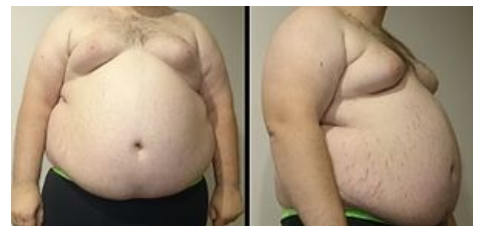
Centrální typ obezity