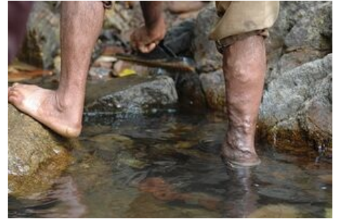
Varixy na pravé dolní končetině

Jako venofarmaka označujeme heterogenní skupinu léčiv užívaných k terapii žilních nemocí, zejména chronické žilní nedostatečnosti . Podstatou účinku je zvyšování tonu žilní stěny , což vede ke zmenšení průsvitu postižených žil a urychlení odtoku krve (zpomalení krevního toku je jedním z hlavních mechanismů trombózy). Dále působí příznivě na mikrocirkulaci, kde snižují permeabilitu a fragilitu kapilár a zlepšují lymfatickou drenáž. Brání tak vzniku otoku a zlepšují trofiku tkáně. Některá z nich mají i mírný protizánětlivý účinek (tribenosid, kalcium dobesilát). V kombináčnících přípravcích se k některým přidávají dihydrované námelové alkaloidy (DH-ergokristin) pro svůj arteriolodilatační, venotonický a kapilarotonický účinek. Do skupiny venofarmak řadíme i sklerotizační látky .