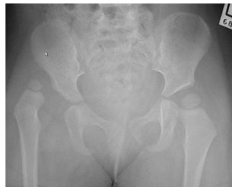
Rentgenový obraz VDK.

3. stupeň – luxace – výrazná deformace acetabula, výrazná antevertze, inverze limbu, protažené ligamentum teres i ligamentum transversum, změny na pouzdru a kloub inkongruentní, v dalším průběhu se zvyšuje tlak na hlavičku, kloubní pouzdro se nadále prodlužuje a uvolňuje, může dokonce srůstat s hlavicí, dochází ke změnám na limbu, prodlužuje se ligamentum capitis femoris, zmnožuje se pulvinar, zvětšuje se valgozita krčku a antevertze, bývá menší hlavička