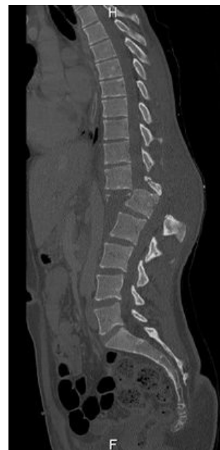
CT luxační fraktura bederní páteře

S vyšším číslem se závažnost fraktury zvyšuje. (pozn.: AO klasifikace se dobře ujala s výjimkou proximální části humeru (AO je moc složitá) a femuru, kde tato klasifikace nepostačuje).