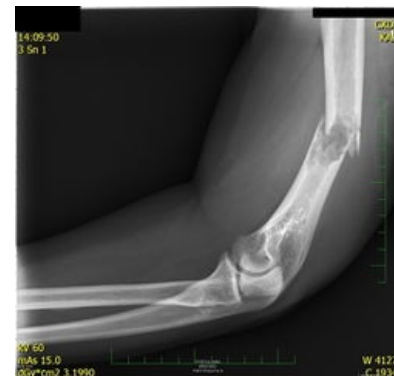
Patologická zlomenina – metastáza nemalobunčného karcinomu plic