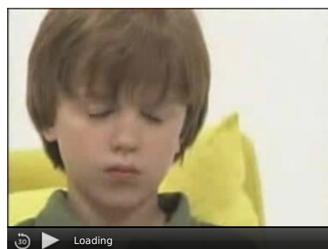
Příklady pohybových tiků