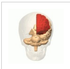
Frontální lalok telencefalonu