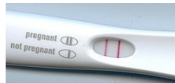
Pozitivní těhotenský test

K oplození vajíčka dochází v období "plodných dnů", což je průměru asi 3 dny před a 3 dny po ovulaci (14. den cyklu). Tento údaj se však u každé ženy liší v závislosti na délce cyklu, menstruace apod. K oplození nejčastěji dochází v oblasti tuby. Oplozená zygoty následně putuje směrem do děložního těla, kde se implantuje v oblasti děložní sliznice. Implantované embryo začne produkovat hormon hCG (choriongonadotropin), který zajišťuje stimulaci žlutého tělíska (produkce progesteronu a estrogenů), které je nezbytné pro udržení a vývoj těhotenství do 5.-7. týdne (progesteron) a zároveň k navození fyziologických změn v těle matky (estrogeny).