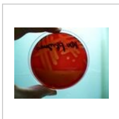
Streptococcus pyogenes, detail \beta -hemolýzy