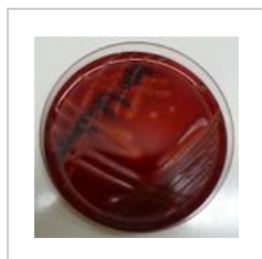
Streptococcus pyogenes na krevním agaru