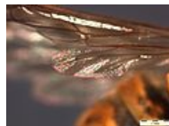
Vespula vulgaris Stereo Microscope křídlo 2