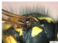
Vespula vulgaris Stereo Microscope křídlo 1