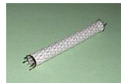
Grafted-stent (8 mm; používáný pro léze aa. iliacae)