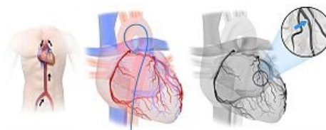
Schéma koronární angiografie.