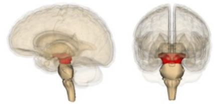
Lokalizace středního mozku

a) Nc. ruber - oválne, veľké, červenkasté, medzi substantia nigra a aquaeductus, regulácia pohybov končatín