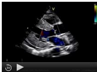
Srdeční amyloidóza s hypertrofií stěn levé komory a zvýšenou echogenitou myokardu (parasternální projekce na dlouhou osu)