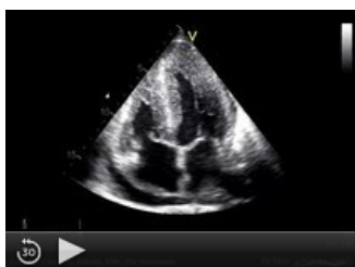
Srdeční amyloidóza s hypertrofií stěn levé komory a zvýšenou echogenitou myokardu (4CH projekce)