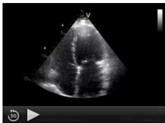
Restriktivní kardiomyopatie s dilatací obou síní (4CH projekce)