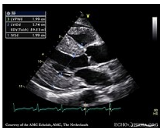
Srdeční amyloidóza s hypertrofií stěn levé komory a zvýšenou echogenitou myokardu (parasternální projekce na dlouhou osu)