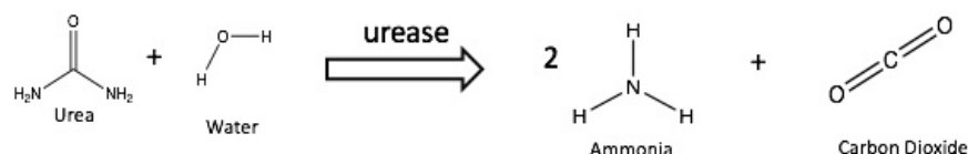
Ureáza katalyzující reakci - schéma

Jedná se o častější formu specifity. Enzym katalyzuje reakce několika podobných substrátů (typicky obsahujících stejné funkční skupiny). Afinita ke každému substrátu může být rozdílná ( K_M se tedy pro jednotlivé substráty liší). Příkladem je karboxypeptidáza B , která hydrolyzuje peptidy z jejich karboxy-konce. Preferenčně štěpí peptidové vazby obsahující nabitě aminokyseliny (arginin, lysin).