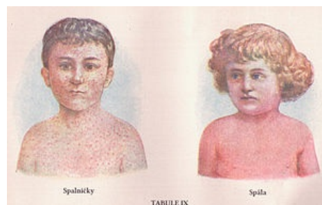
Spalničky vs. spála