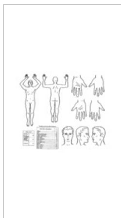
Tabulka podle Lunda-Browdera pro dospělé pacienty