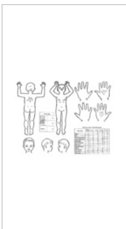
Tabulka podle Lunda-Browdera pro dětské pacienty