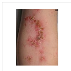
Impetigo na předloktí