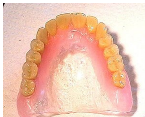
Mukózní přenos u celkové zubní náhrady