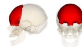
Čelní kost v lebce