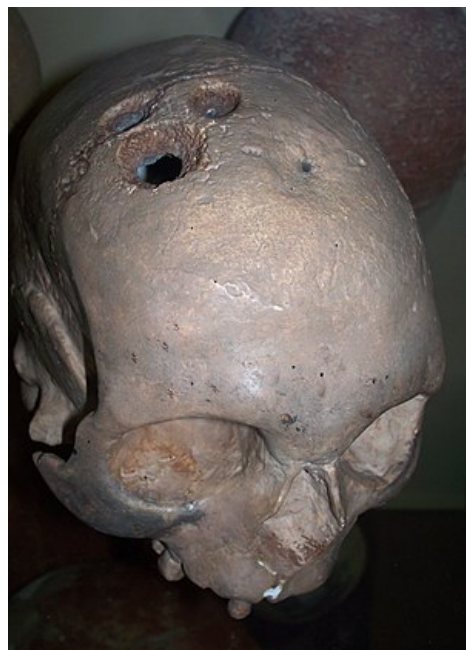
Trepanovaná lebka z doby bronzové