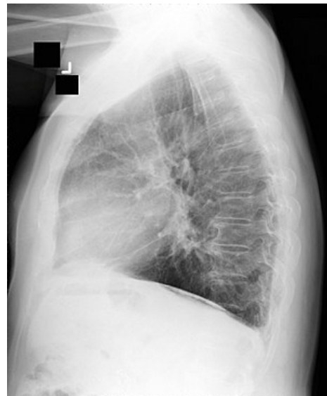
Azbestóza – bazální zastínění na RTG

Pleurální fibróza aspoň 50 mm široká, 80 mm vertikálně, tloušťka 3 mm (dle CT). Kolem – okrouhlé atelektázy ( rounded atelectasis ), prolínání léze do parenchymu se popisuje na CT jako crow's feet (vrání nohy).