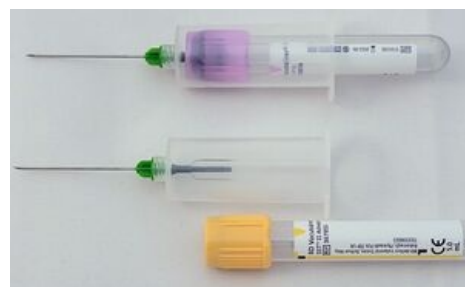
Vakuový odběrový systém s oboustrannou jehlou.