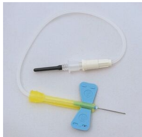
Jehla s křídélky („motýlek“)

Pod končetinu, ze které budete odebírat krev, dejte papírovou podložku.