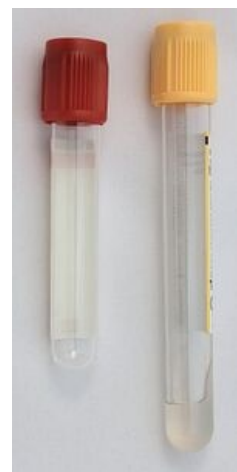
Vakuované zkumavky pro odběr séra. Zkumavka se zlatým uzávěrem obsahuje separační gel.

Přídavek heparinu poměrně málo ovlivňuje běžná biochemická stanovení. Nejčastěji se používá lithná sůl heparinu, neboť na rozdíl od heparinátu sodného nebo draselného nemění koncentraci sodíku či draslíku, tedy základních a běžně stanovovaných iontů.