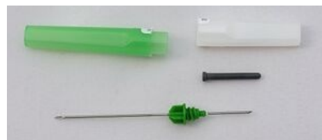
Oboustranná odběrová jehla