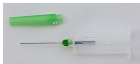
Odběrová jehla připravená k zavedení do žíly.