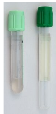
Vakuované zkumavky pro odběr krevní plazmy. Zkumavka se světle zeleným uzávěrem obsahuje separační gel.

Pro dezinfekci kůže se doporučují alkoholové dezinfekční prostředky, nejčastěji 70% 2-propanol . Kromě požadavků na antimikrobní účinnost je z hlediska preanalytické fáze vhodné, aby se dezinfekční prostředek rychle odpařoval. Kontaminace odebírané krve alkoholem totiž vede k hemolýze a tím ke znehodnocení vzorku pro řadu stanovení.