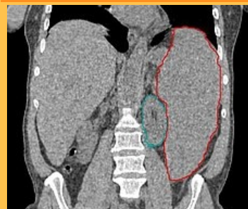
CT, zvětšení sleziny (červeně) v důsledku myelodysplastického syndromu, levá ledvina zeleně

9820/3 ( http://codes.iarc.fr/code/4502 )