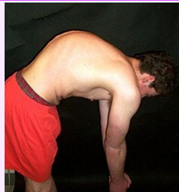
Pacient s Scheuermannovou chorobou