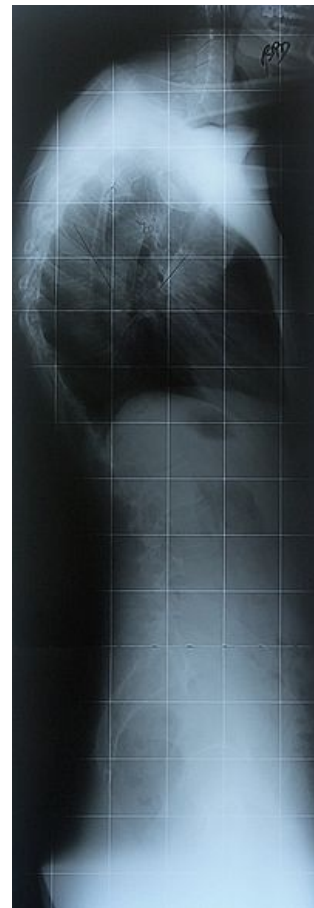
Morbus Scheuermann na RTG