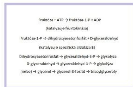
Metabolismus fruktózy v těle