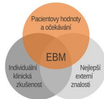
Tři složky EBM

Při tvorbě plánu léčebné péče je nutné brát v úvahu i další, nemedicínské faktory, jako jsou osobní preference, životní styl, postoje k porušení tělesné integrity, náboženské přesvědčení, kulturní a sociální tradice a potřeby. Pokud nejsou tyto faktory brány v péči v úvahu, může i formálně nejlepší terapie vést ke špatným výsledkům (nemusí být například pacientem akceptována a dodržována, protože se protiví jeho postojům, nevyhovuje jeho životnímu stylu, má odpor k danému způsobu aplikace, atd). Formálně méně úspěšná terapie, která ale vyhovuje nastavení pacienta, může přinést lepší zdravotní výsledky i kvalitu života pacienta než terapie formálně sice úspěšnější, avšak nerespektující pacientovy hodnoty, potřeby a postoje. S respektováním pacientových přání a potřeb souvisí i právní aspekty péče: Úmluva o lidských právech a biomedicině, Informovaný souhlas.