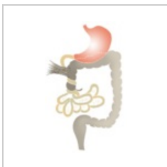
Volvulus tenkého střeva.