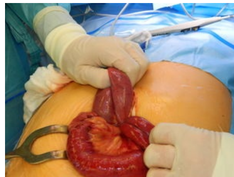
Volvulus tenkého střeva.