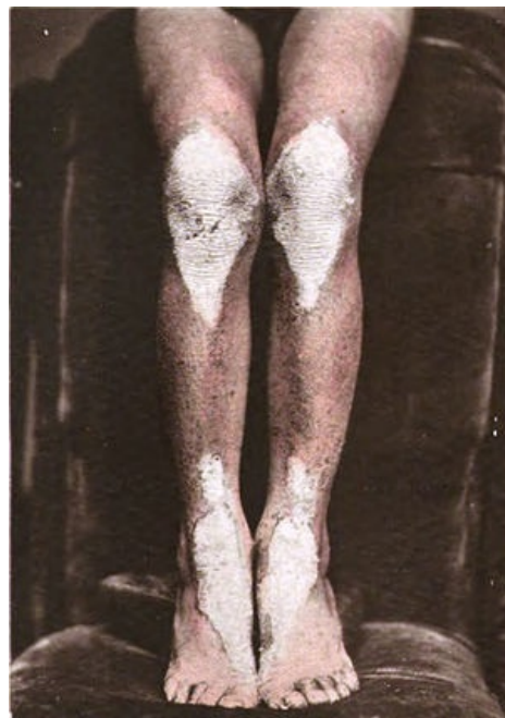
Lichen ruber – bělavá ložiska (Wickhamovy strie) na kolenou a hleznech