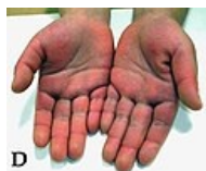
Erytém a tuhé otoky rukou a nohou + otok PIP kloubů ruky