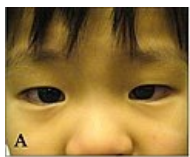
Bilaterální, neexsudativní konjunktivální injekce