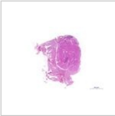
Štítná žláza, HE, ... 783 × 540; 223 KB