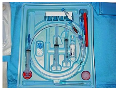
Pomůcky pro centrální kanylaci

Dodržujeme přísné aseptické podmínky, tj. dezinfekce místa vpichu, překrytí místa vpichu sterilní perforovanou rouškou. Výkon provádíme ve sterilních rukavicích, sterilním plášti a roušce. Nejvhodnější je technika dle Seldingera. Po zavedení katetru místo vpichu opětovně dezinfikujeme, katetr dobře fixujeme a sterilně kryjeme (za nejvhodnější považujeme fixaci CVK ke kůži minimálně 3 stehy). Rutinní by měla být kontrola polohy katetru. Výkon