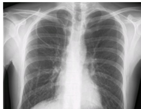
Skiagrafická kontrola zavedení katétru do podklíčkové žíly