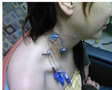
Zavedený centrální žilní katétr