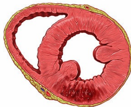
Infarkt myokardu dolní stěny