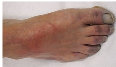
Ischemie prstů dolní končetiny – projevem je cyanoza tkáně

video v angličtině: definice, patogeneze, příznaky a komplikace, diagnostika, léčba