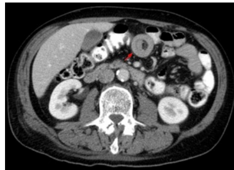
Invaginace na CT