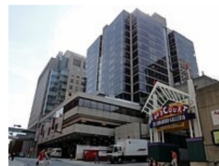
Sídlo Dana-Farber Cancer Institute

Výsledky dalších klinických testů byly tak úžasné, že dne 13. května 2003 FDA povolil bortezomib pro léčbu pacientů s relapsujícím mnohočetným myelomem, a to ještě předtím, než byla dokončena 3. fáze klinických testů, která je obvykle pro takové povolení nezbytná. V roce 2008 byl bortezomib v USA povolen jako lék první volby proti mnohočetnému myelomu a dnes se používá zejména v kombinaci s jinými léčivy [1] . Bortezomib je indikován k léčbě mnohočetného myelomu běžně i v Evropě, v Japonsku a jinde na světě. Pro Millenium Pharmaceuticals se tento lék stal velmi významným zdrojem příjmů (podle zmíněného článku v Boston Globe jde asi o třetinu všech zisků firmy). Ve mnoha případech bortezomib ovšem nepředstavuje úplnou léčbu nemoci, nýbrž „jen“ prodloužení života v řádu měsíců.