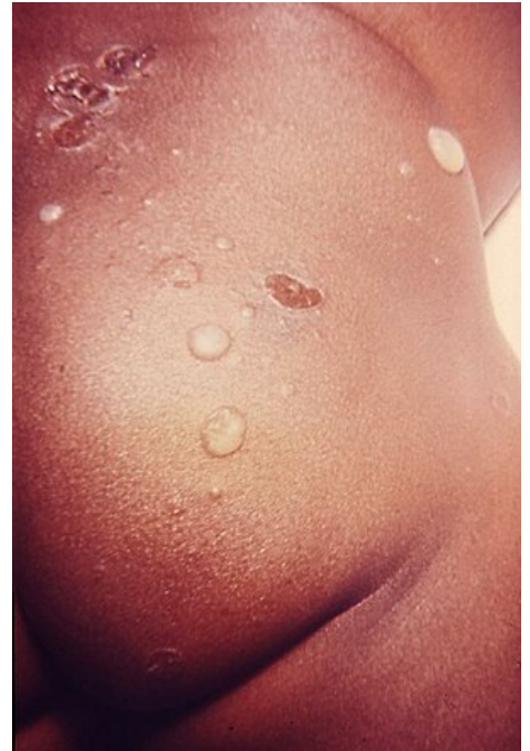
Kožní léze při impetigu