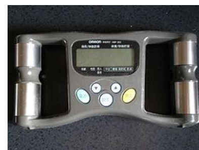
Přístroj na měření % tělesného tuku pomocí bioelektrické impedance