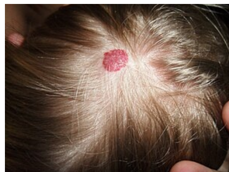
Hemangiom na vlasaté části hlavy