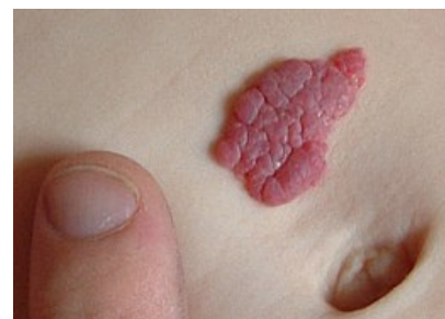
Jahodové znaménko - juvenilní hemangiom.