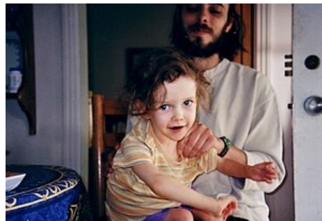
Dítě s glutarovou acidurií

GA1 je způsobena deficitní nebo nefunkční glutaryl-CoA dehydrogenázou