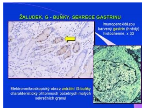
Žaludek, G-buňky, sekrece gastrinu