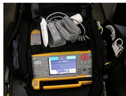
Přenosný manuální externí defibrilátor