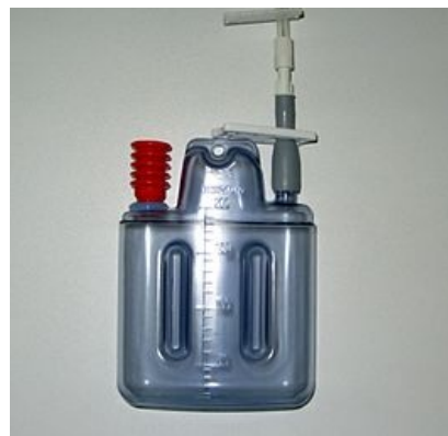
Podtlaková sběrná lahev na Redonovu drenáž

Do rány se vloží rukavicový, mulový či Penrose drén , který odvádí sekret do obvazu . Při vyšší viskozitě a větším množství sekretu je účinnost drenáže omezená.