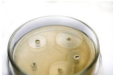
DDT – inhibiční zóny