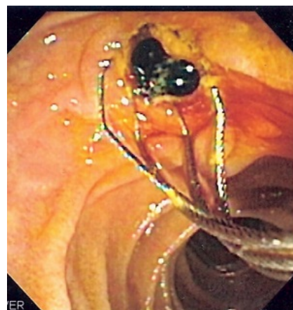
Duodenoskopie – extrakce pigmentového kamenu ze žlučvodu