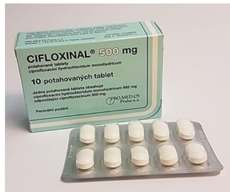
Cifloxinal®, hromadně vyráběný léčivý přípravek s ciprofloxacinem pro perorální podání

Eliminaci zpomaluje pouze výrazně snížená renální clearance, úprava dávky většinou není nutná. Interakce : významně zpomaluje metabolismus teofylinu (vždy je nutná kontrola plazmatických koncentrací teofylinu, případně volba jiného antibiotika). Indikace : široké jako u ofloxacinu – infekce močových cest, enterokolitidy všeho druhu, břišní tyfus, cholera, pseudomonádové infekce.