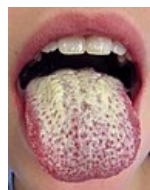
Kandidová infekce jazyka