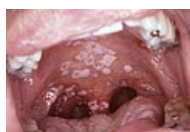
Orální kandidóza (soor)