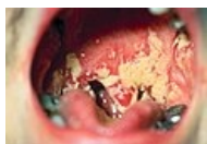
Orální kandidóza (soor)

Také profesionálně jako předchozí. Chronické zánětlivé zduření a zarudnutí valu, ze kterého lze vytlačit kapku bělavého exsudátu.