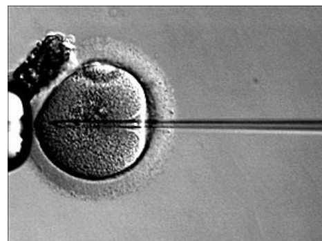
Intracytoplazmatická injekce spermie